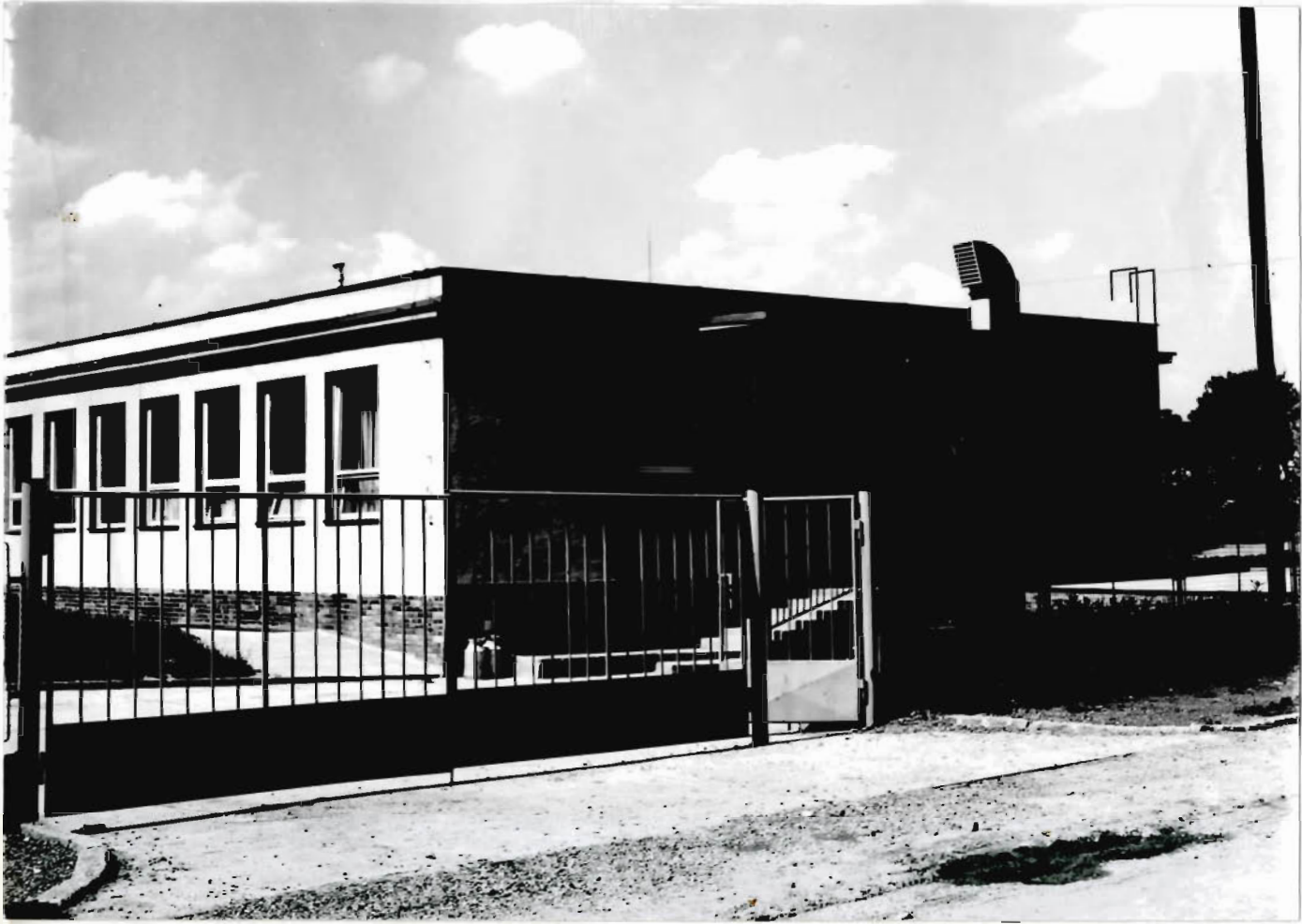
Nova' školske' jidelna pred odevicim.