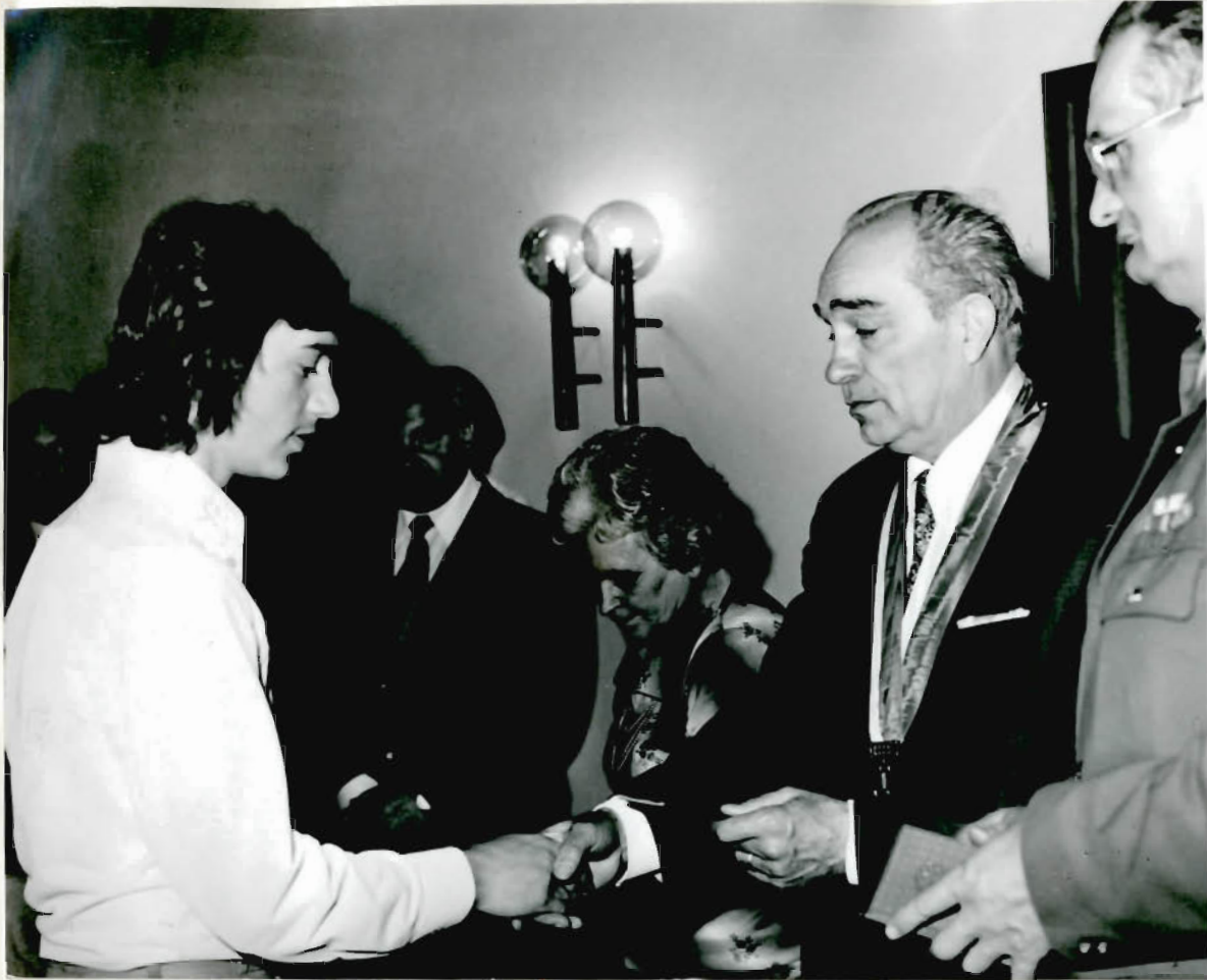
Významný akt - předání občanských příkazů