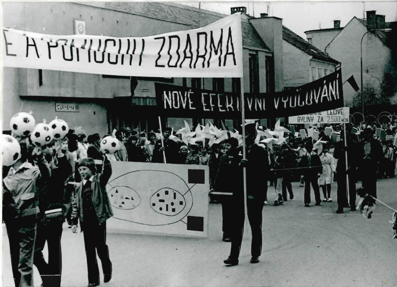
obhled na čelo průvodu