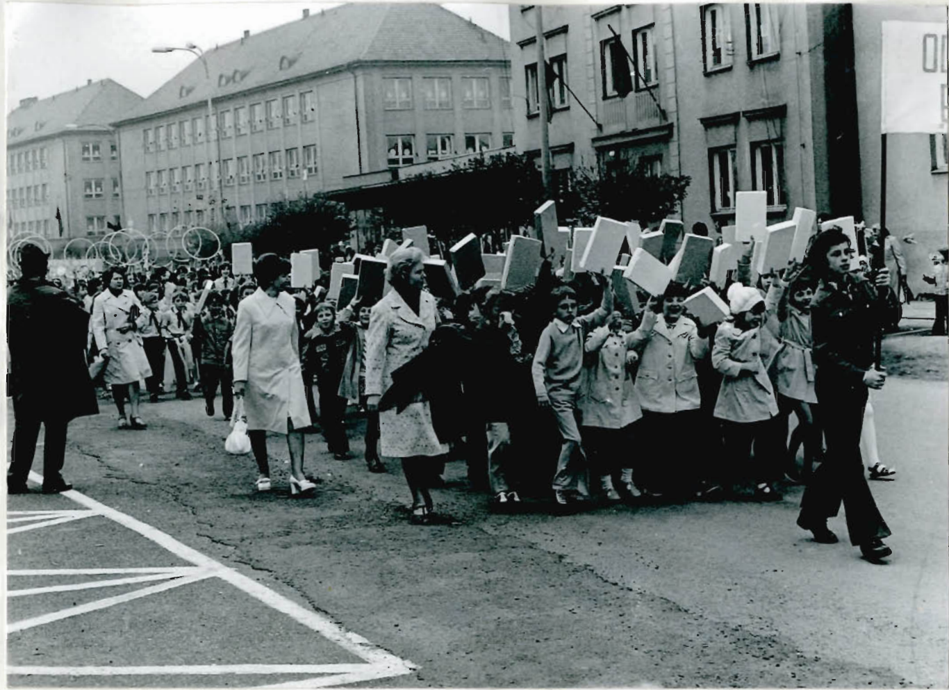
Naši mladí stavitelé