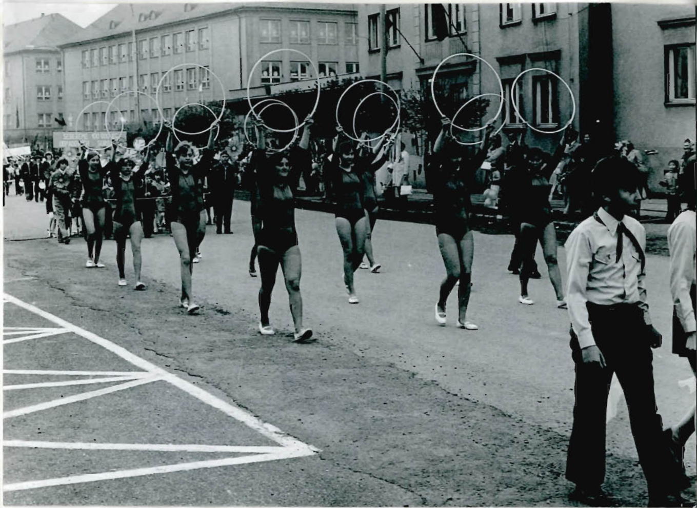
gymnastky s obušemi