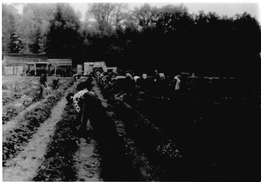
Výrobní práce žáků 7. p. v. na jako- tových parcelách