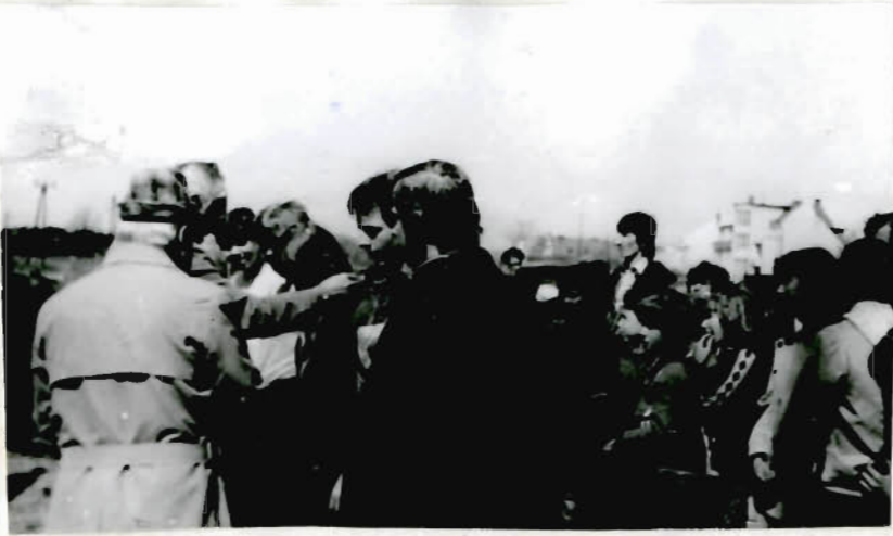
Rozdílání cen vítězným družstvům a jednotlivcům.